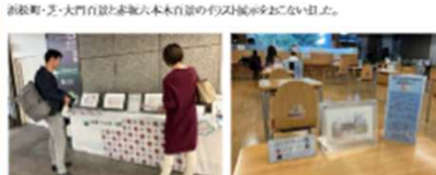
浜松町・芝・大門百景と赤坂六本木百景のイラスト展示をおこないました。