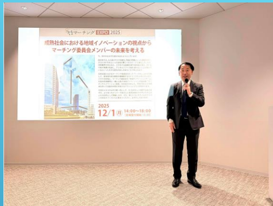
コニカミノルタパシフィック(株)一条社長