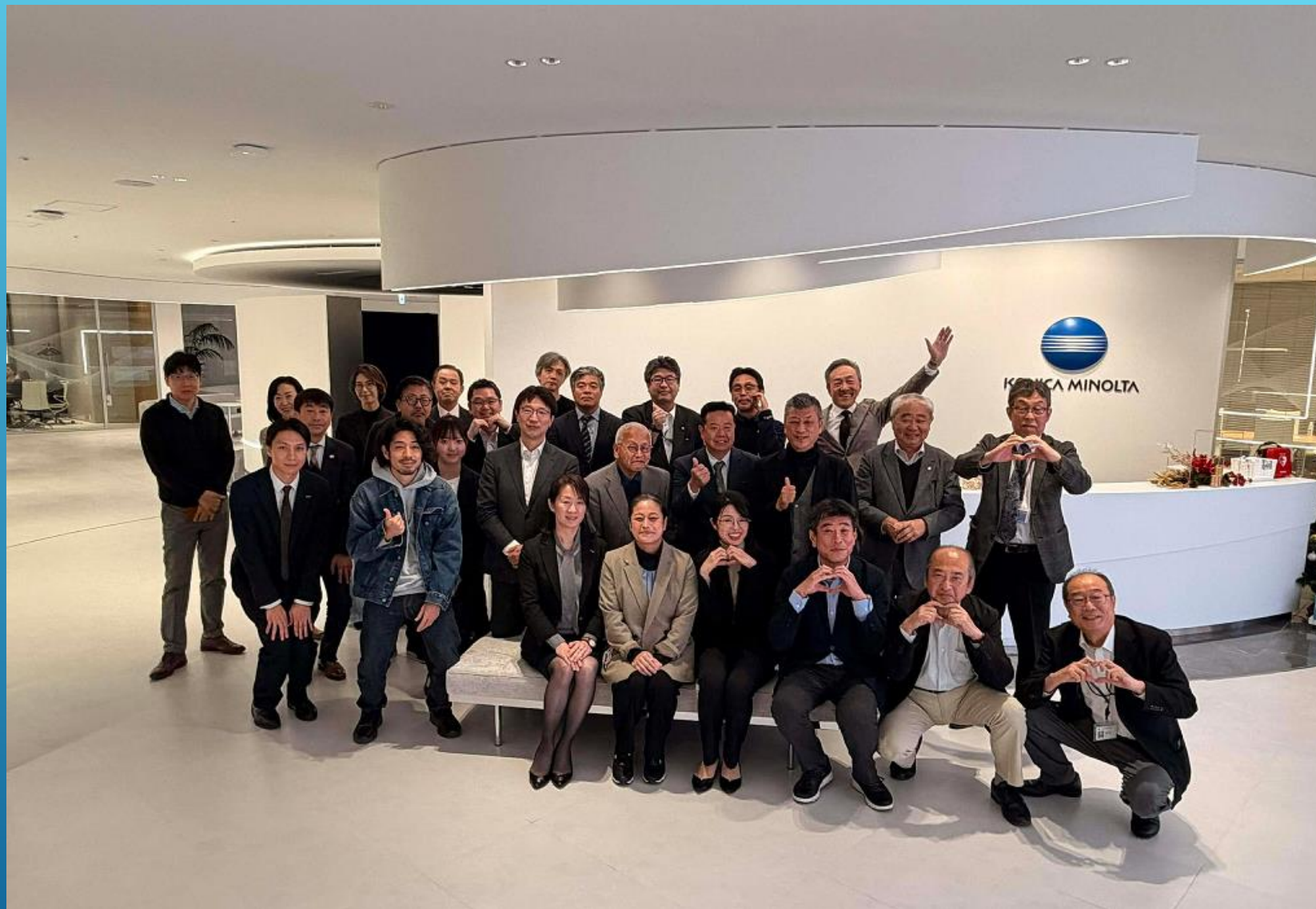
全国から参加した皆様